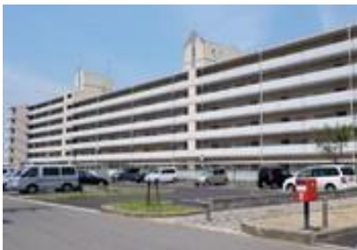
雨でも濡れない市営団地で

八幡浜市 では6月2日に20名の参加で、市内中心部と保内町を中心にして署名集中アクション(各戸訪問)にとりくみ、短時間でしたが306筆集まりました。まったく見ず知らずのお宅を訪問しての会話でしたが、「もう原発はいらない」との反応が結構ありました。参加者の一人は「もっと早く来なイカン！」と熱い激励を受けたと語っていました。