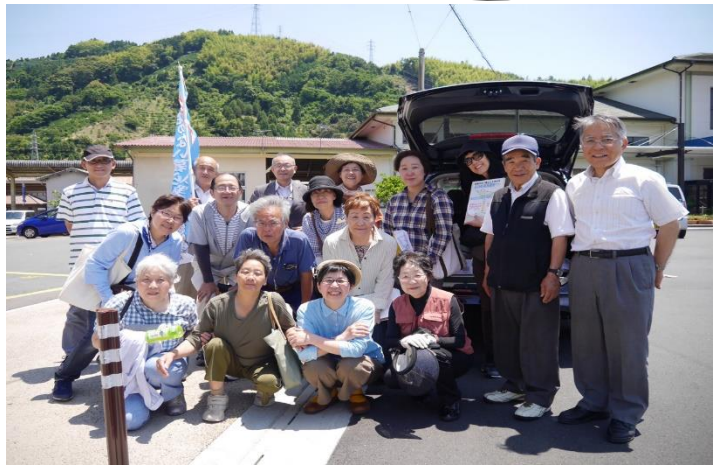
6/2の八幡浜市での集中アクションで306筆集まる

署名期間も1ヶ月余りとなってきましたので、1200人の呼びかけ人お一人おひとりのラストスパートで署名の飛躍をつくり、早く10万筆を超えそして30万筆へ到達させましょう。